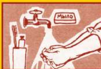
Регулярно мойте руки