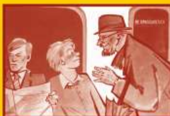
Ограничьте пребывание в местах скопления людей