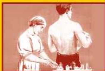
Сделайте прививку от гриппа