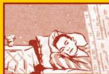
Избегайте контактов с заболевшими